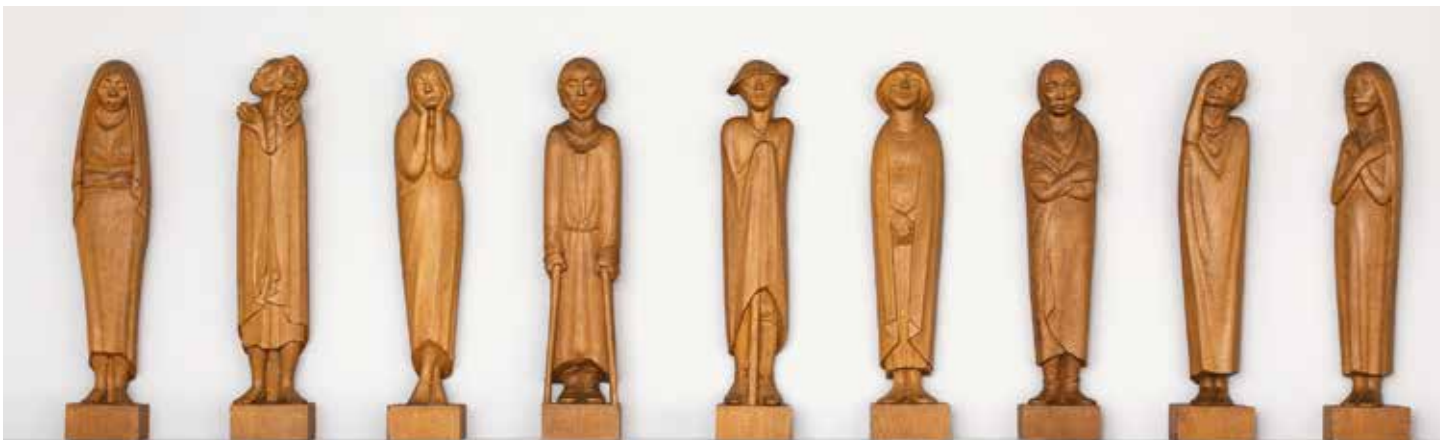
Die Träumende Der Gläubige Die Tänzerin Der Blinde Der Wanderer Die Pilgerin Der Empfindsame Der Begnadete Die Erwartete