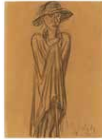
Der Wanderer, 1926 Kohle auf Zeichenpapier

Im Zentrum seines Schaffens steht die Beschäftigung mit dem Menschen, seinen Lebensverhältnissen und den damit verbundenen Gefühlszuständen. So ist es Barlachs Anliegen, die menschliche Figur, die er in reduzierter äußerer Form darstellt, in ihren Empfindungen innerlich zu erfassen. Er interessiert sich, wie er es selbst formuliert, für „das