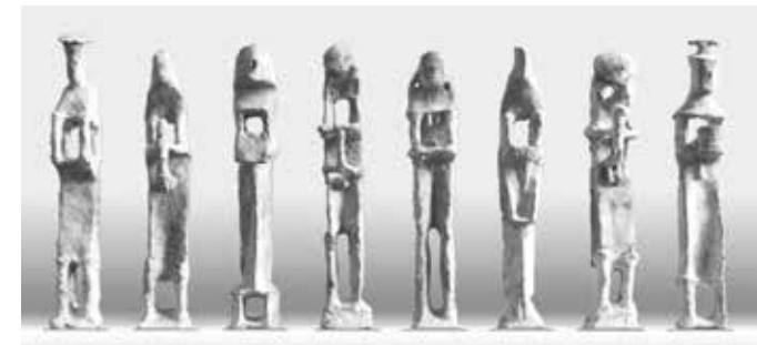
Lothar Fischer Enigma-Variationen (Modelle), 1996 Museum Lothar Fischer © VG Bild-Kunst, Bonn 2023