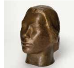
Bildnis Tilla Durieux III, 1912 Bronze mit grünlicher Patina

Im Neumarkter Museum steht der Fries der Lauschenden mit seinen neun Holzskulpturen im Mittelpunkt der Präsentation und somit erstmals im spannungsreichen Dialog mit Lothar Fischers acht weißen Enigma-Variationen von 1996/1997 aus Styropor und Gips. Sowohl Barlachs als auch Fischers überlebensgroß wahrnehmbare Figurenreihen sind gleichermaßen beeindruckend wie rätselhaft. Sie machen die Sonderschau mit insgesamt 28 Arbeiten zu einem besonderen Erlebnis, das in keinem anderen Ausstellungshaus in dieser Form vermittelt werden kann.