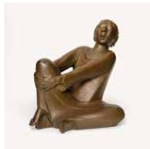
Der singende Mann, 1928 Bronze

Öffnungszeiten Mi – Fr 14 bis 17 Uhr, Sa/So 11 bis 17 Uhr Bei Abendveranstaltungen durchgehend geöffnet 24. und 31. Dezember geschlossen