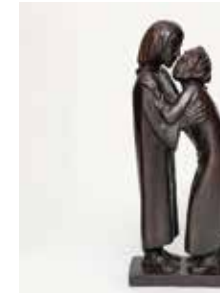
Das Wiedersehen (Thomas und Christus), 1936 Bronze

unheimliche Rätselwesen Mensch“. Dies zeigen nicht nur seine bekannten Bronzen Der Berserker , Der Rächer , Frierendes Mädchen , Verhüllte Bettlerin oder Der singende Mann , sondern auch der berühmte Fries der Lauschenden aus den Jahren 1930 bis 1935. An dieser Figurengruppe und den damit verbundenen Zeichnungen arbeitet der Künstler 1934, als der Hamburger Fabrikant Hermann F. Reemtsma ihn erstmals in seinem Atelier in Güstrow besucht. Zu seiner großen Freude erhält Ernst Barlach, der sich in der Gestalt Der Wanderer vermutlich selbst darstellt, von Hermann F. Reemtsma damals den Auftrag zur Vollendung des Figurenensembles. Später schreibt Barlach: „Arbeiten zu dürfen an diesem Werk, schob mich durch die Zeit und hob mich über ihre schlammigen Gründe.“