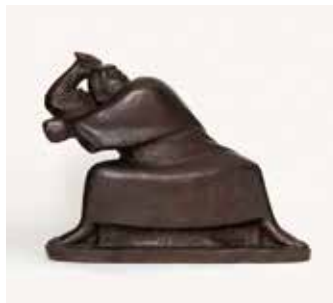
Der Berserker, 1910 Bronze